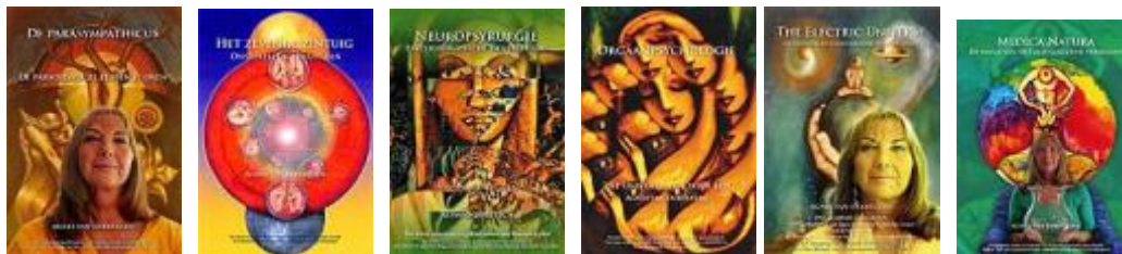
De parasympathicus, Het zevende zintuig, Neuropsychurgie, Orgaanpsychologie, The Electric Universe, Medica Natura.