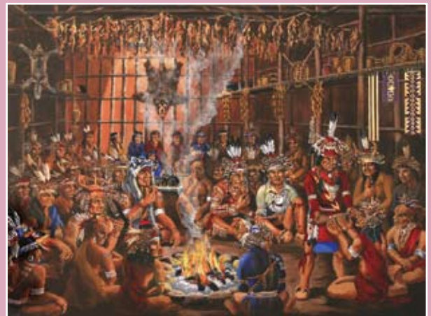
Haudenosaunee-ceremony, Mohawks in het longhouse.

D e westerse mens heeft zijn identiteit opgehangen aan politieke en economische systemen die niets meer waard blijken. Onze spirituele ontwikkeling is daardoor in de kinderschoenen blijven staan. Gelukkig zien steeds meer mensen dat natuurliefden uit alle windstreken, met hun tradities en cultuur, de kennis en leefwijzen hebben bewaard, die onze spirituele armoede kunnen upgraden. Eeuwen geleden voorzagen deze beschavingen in hun profetieën en overleveringen al dat de crisis waarin wij ons nu bevinden, zou aanbreken. Maar óók dat we gezamenlijk de oorspronkelijke levenswaarden weer nieuw leven in moeten blazen, door onze krachten te bundelen in vriendschap. Zo kunnen we de heftige veranderprocessen die momenteel wereldwijd op diverse niveaus ontwrichtingen veroorzaken, leren begrijpen en ondersteuning bieden. Verborgen onze Nederlandse en Indiaanse voorouders misschien een sleu-