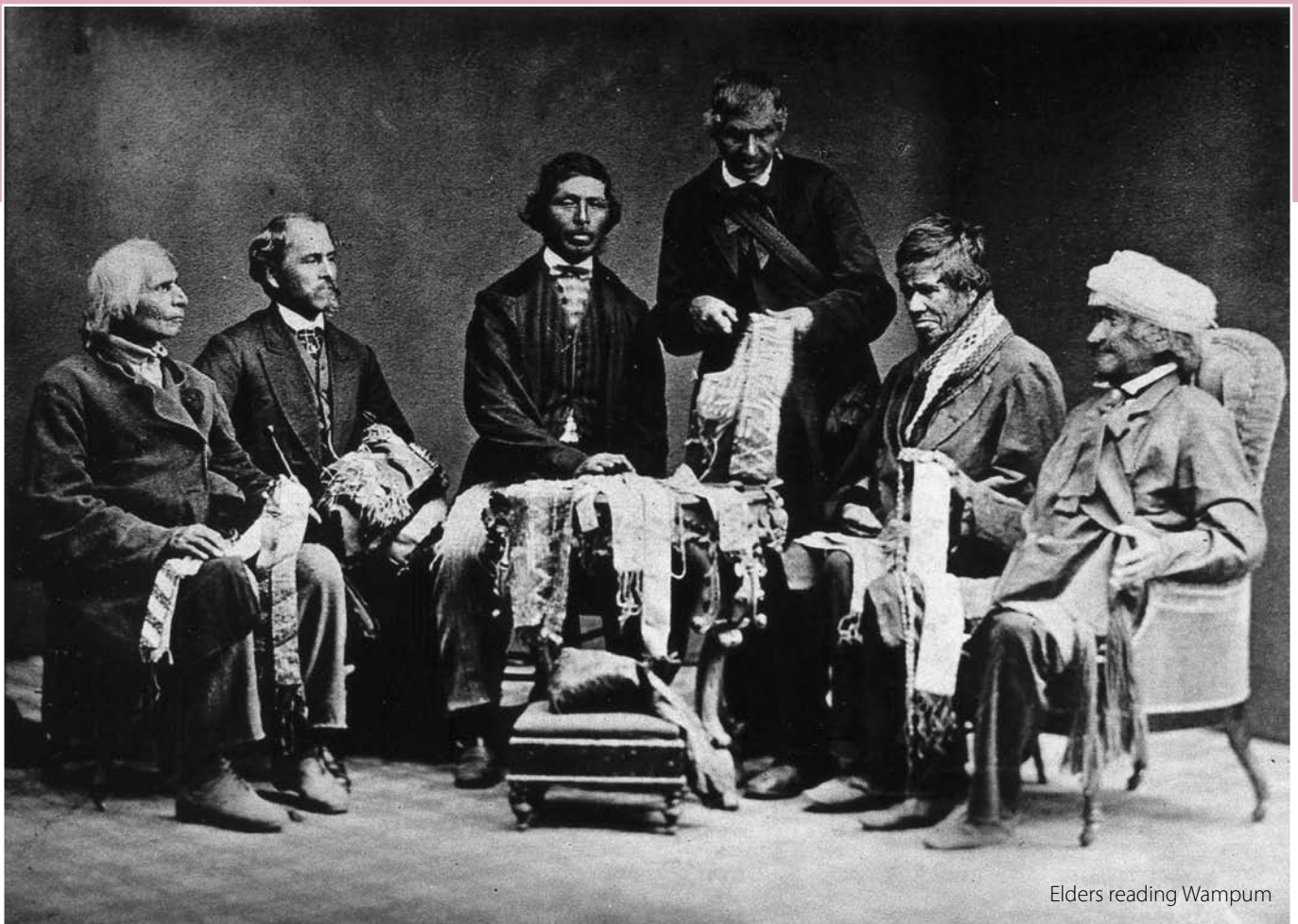
Elders reading Wampum

Nederlanders en Irokezen, de historische feiten voorbij