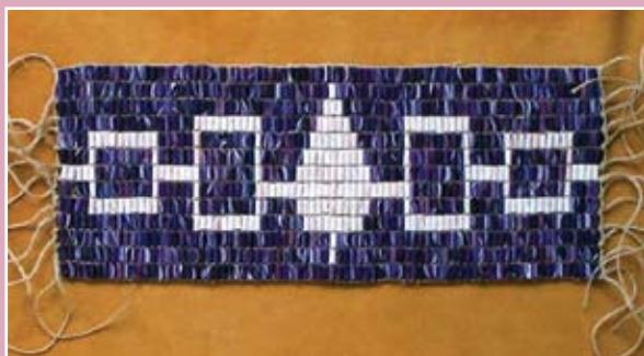
Het symbool, of de vlag van de Six Nations (ook gemaakt van Wampum)

Met name de laatste decennia worden 'bij