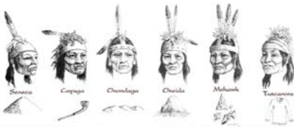
De zes stammen van de Irokezen: Seneca, Cayuga, Onondaga, Oneida, Mohawk en Tuscarora.